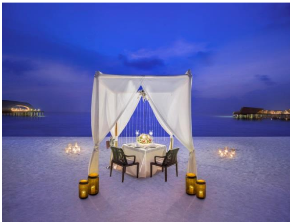
Romantisches Abendessen am Strand

Frankfurt am Main, 3. Januar 2018 – Am 14. Februar 2018 ist Valentinstag: Um den oder die Liebste(n) zu beschenken, eignet sich nichts besser als eine gemeinsame Reise zu einem der schönsten Romantikziele der Welt – den Malediven. Für alle Verliebten ist The St. Regis Maldives Vommuli Resort die ideale paradiesische Kulisse, um die Liebe zu zelebrieren: Paare freuen sich auf ein speziell für den Valentinstag entworfenes Spa-Erlebnis zu zweit im Iridium Spa sowie ein privates Abendessen am Strand mit Blick auf den Indischen Ozean.